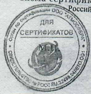
Схема сертификации: 1с (ГОСТ Р 53603-2009. Оценка соответствия. Схемы сертификации продукции в Российской Федерации)